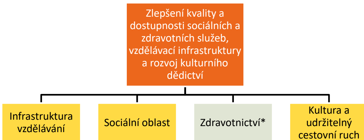
Schéma níže je výčet oblastí (specifických cílů) v prioritní ose 4:

*Oblast zdravotnictví není zahrnuta v ITI